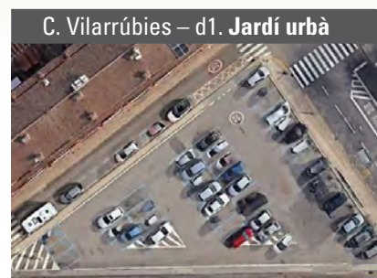
C. Vilarrúbies – d1. Jardí urbà