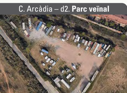
C. Arcàdia – d2. Parc veïnal

Alguns exemples dels 13 aparcaments il·legals localitzats: