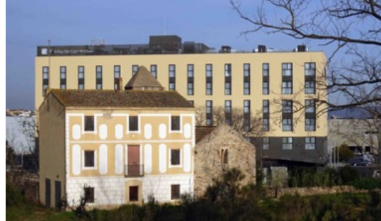
Ermita i Rectoria de Sant Pau de Riu-sec

A pesar d'aquesta importància tot el conjunt ha estat poc respectat i menystingut. Marginat amb la construcció del polígon comercial, va ser ocultat amb la gran rotonda viària; les restes arqueològiques de la vila romana abandonades; la masia de Can Borrell de Sant Pau, de propietat municipal, en estat de ruïna. Ara, la construcció d'un hotel de passavolants a tocar ha acabat de donar el toc de marginalitat a aquest espai patrimonial.