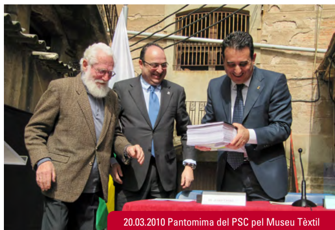
20.03.2010 Pantomima del PSC pel Museu Tèxtil