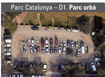
Parc Catalunya – D1. Parc urbà