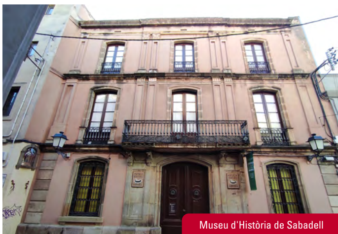
Museu d'Història de Sabadell