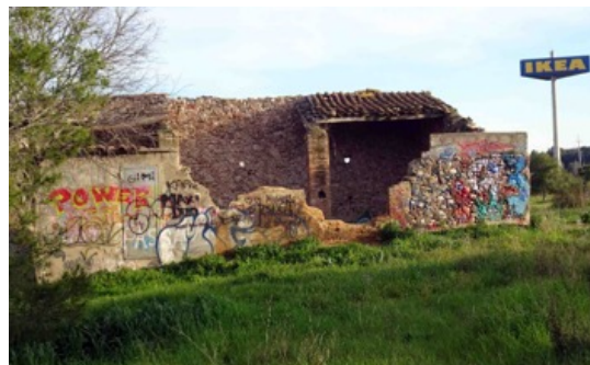
Masia de Can Borrell de Sant Pau