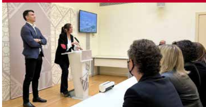
Roda de premsa anunciant el SurfCity

negació de diàleg tot i ser un projecte de gran repercussió; clientelisme a canvi del suport al projecte; malbaratament de recursos públics dedicant molts tècnics municipals a un projecte privat, etc.