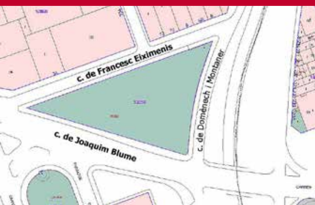
Ubicació i vista del solar proposat

Una proposta viable, adequada, lliure de cap condicionant i amb un mínim impacte a nivell de contaminació acústica .