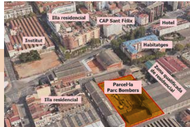
Ubicació proposada i entorn