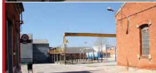
Antiga fàbrica del gas del carrer Buxeda