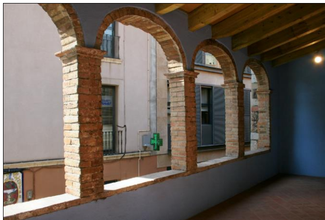
Interior galeria porxada utilitzada com assecador

La galeria porxada sense tancaments de la planta pis era l'espai destinat a assecat les peces de sabó que s'elaboraven a la planta baixa. En aquest sentit cal entendre la Saboneria com un conjunt únic format pels elements de la fàbrica de sabó de la planta baixa i la galeria ventilada del pis per assecat el sabó.