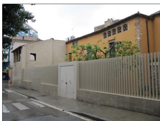
Vista actual del mur