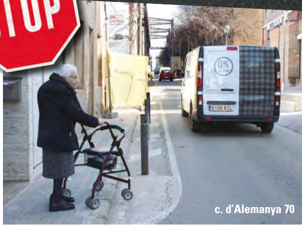
c. d'Alemanya 70