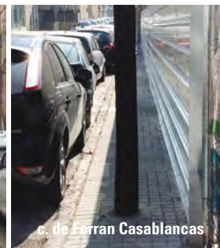
c. de Ferran Casablanques