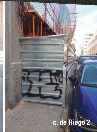
c. de Riego 2