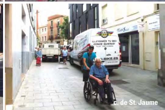
c. de St. Jaume