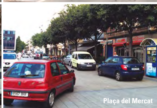
Plaça del Mercat