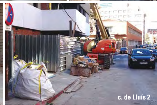
c. de Lluís 2