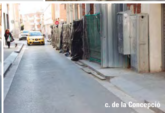
c. de la Concepció