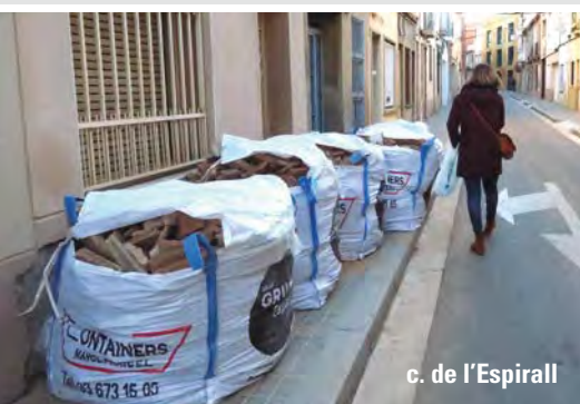
c. de l'Espirall