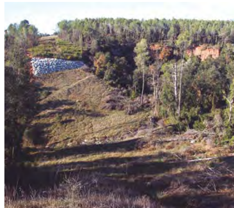
Pas del Gasoducte pel Torrent de Colobres i estat actual de l'afectació.

Algú acabarà assumint les responsabilitats del desastre?