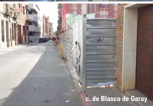
c. de Blasco de Garay