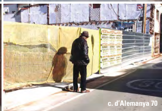
c. d'Alemanya 70