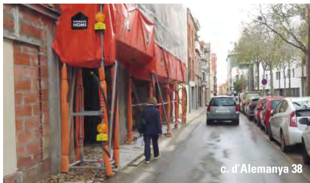
c. d'Alemanya 38