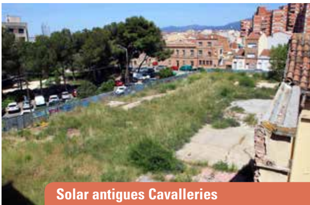
Solar antigues Cavalleries

La Caserna la va construir la ciutat i el seu nou ús ha d'anar destinat a satisfer les necessitats de tota la ciutat.