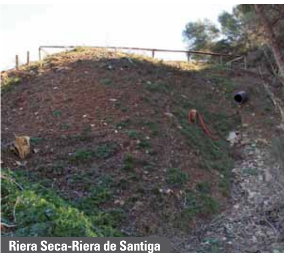
Riera Seca-Riera de Santiga