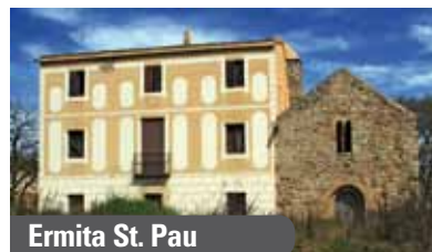
Ermita St. Pau