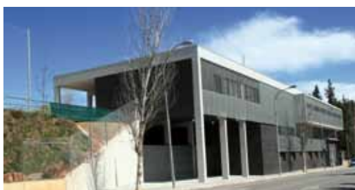
Edifici per a la Federació Catalana de Futbol

L'Entesa ha demanat al govern municipal que deixi sense efecte el conveni subscrit amb la Federació Catalana de Futbol i anul·li el projecte de la Ciutat Esportiva Sabadell-Olimpia que està transformant aquest complex en un espai privat i exclusiu per al futbol, per cedir-lo a aquesta entitat privada ni més ni menys que per 50 anys.