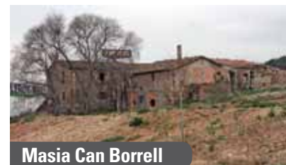
Masia Can Borrell

El Polígon de Sant Pau de Riu-sec es va vendre com "el gran motor de la reindustrialització de Sabadell". El govern municipal del PSC, tot i no ser el propietari del polígon, es va dedicar a generar titulars anunciant que seria el parc industrial i tecnològic del Vallès, amb empreses d'alt valor afegit vinculades a la indústria aeronàutica. L'alcalde Manuel Bustos, va arribar a proclamar que generaria 10.000 llocs de treball i que seria la Toulouse d'Espanya .