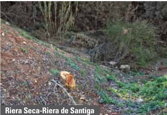
Riera Seca-Riera de Santiga