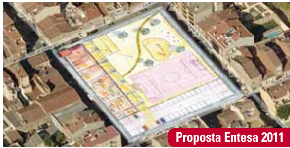
Proposta Entesa 2011