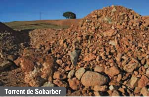
Torrent de Sobarber