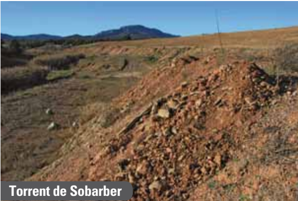
Torrent de Sobarber