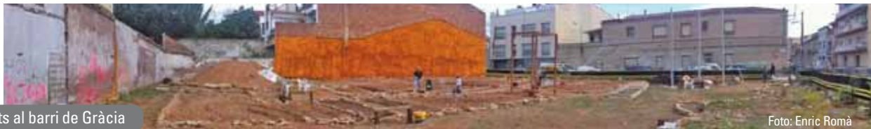
Horts al barri de Gràcia