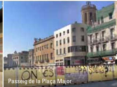
Passeig de la Plaça Major