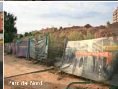
Parc del Nord

Finalment, a començament de febrer, es va confirmar que la Generalitat aturava les obres del perllongament dels FGC a Sabadell. No podem dir que l'anunci ens agafés a contrapeu, perquè ja feia mesos que veníem denunciant que des de l'estiu únicament funcionava la tuneladora; la novetat va ser que el propi conseller de Política Territorial en fes l'anunci formal. Un anunci que situava la represa de les obres cap al mes de setembre, afirmació que no té cap mena de credibilitat perquè no es basa en cap planificació o estudi de viabilitat.