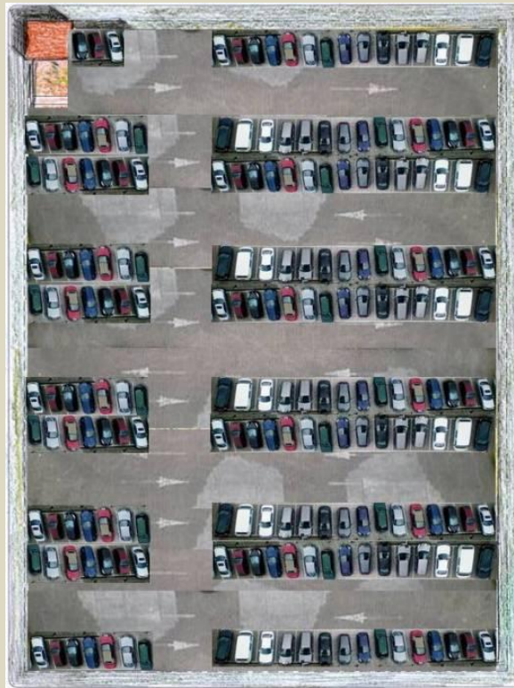
Omplir-lo de cotxes