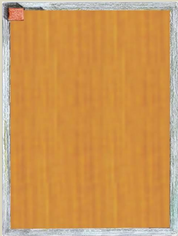
El solar buit i tancat