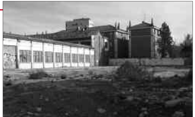
Solar que ocupaven les cavalleries

Tanmateix, la primera fase del Parc de Salut es podria construir al solar que ocupaven les cavalleries, ja retornat a la ciutat l'any 2006.