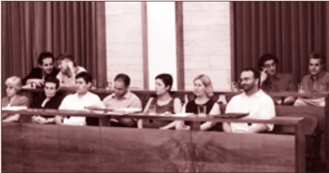
Fons: Ajuntament de Sabadell.

A Sabadell la campanya electoral continua. El treball de l'alcalde consisteix a ser present als llocs, estrènyer mans, fer-se fotos i algunes visites i recepcions. I mentre, qui treballa per la ciutat? On i amb qui es reflexiona sobre la ciutat?