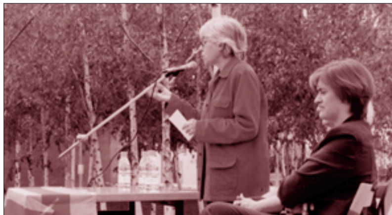
Fons: Entesa per Sabadell

Un cop fet el carrer sense fer cas dels veïns, les proves no aconseguen fer passar l'autobus per HORTA NOVELLA