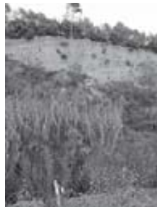
Talussos del Ripoll