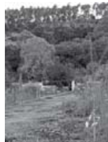
Talussos del Ripoll