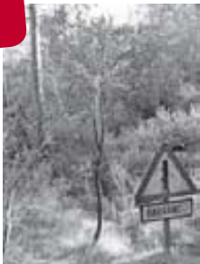
Torrent de Can Deu