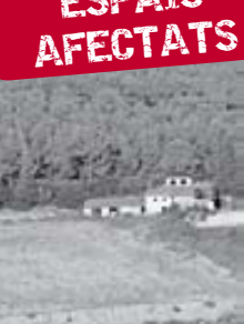
Bosc de Can Bages