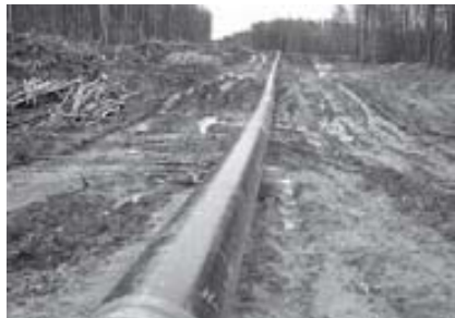
Impacte que tindrà