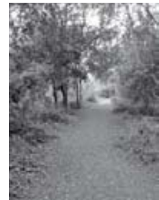
Bosc de Can Deu