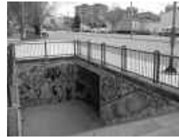
Passos Gran Via soterrats.