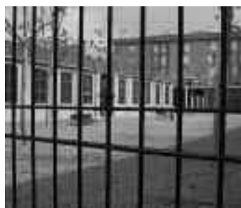
Adequació de la Plaça del Fantasma de la Nau