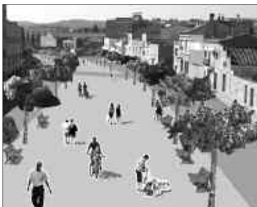
Proposta de l'ENTESA

Soterrar la via del tren des de Sabadell Estació fins Sant Quirze del Vallès és un projecte cabdal per Gràcia i Can Feu, per la ciutat i per la comarca. La seva realització ha de servir per: