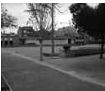
Rehabilitació de la Plaça de Treball