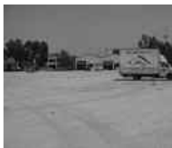
Urbanització de la Plaça de les Corts Catalanes