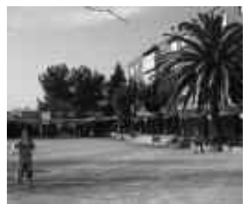
Reforma de la plaça Cambó