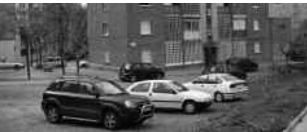
Espai c. d'Urà / c. de Mercuri.

Fomentar la rehabilitació integral d'aquest conjunt d'habitatges és una prioritat per l'Entesa, per millorar les seves condicions urbanístiques i socials.