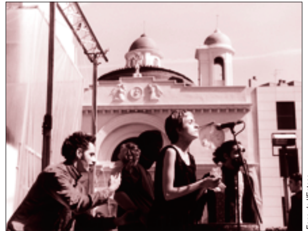
Fons de l'Entesa

Aquests últims anys, Sabadell ha celebrat el Dia de la Dona Treballadora oferint el protagonisme a les associacions de dones de la ciutat. Des de l'Entesa compartim plenament la lluita per la igualtat de gèneres. Però aquest any s'ha de destacar un nombre considerable d'actes organitzats directament des de la Regidoria per a la Igualtat; com ja vam avançar fa un temps l'Ajuntament de Sabadell està esdevenint un ajuntament franquícia; en aquesta ocasió s'ha sumat un pack d'actes de la Diputació de Barcelona com si els 42 actes organitzats per les entitats locals no fossin suficients ni tinguessin prou interès. No hi ha hagut presentació pública conjunta Entitats – Ajuntament; com ja era habitual. On hi havia "foto" només existia l'Ajuntament. A vosaltres què us sembla? La gran participació de què presumeix aquest equip de govern només implica escoltar les entitats (segurament per falta de criteris, de model) o, també caldria compartir-ne la gestió i el protagonisme ?