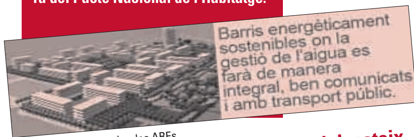
Propaganda oficial sobre les AREs.

Amb les AREs la Generalitat ha optat doncs per una política neoliberal i insostenible per afrontar el problema social d'accés a l'habitatge: construir més i més pisos en sòl rústic, garantint d'aquesta manera que les constructores, immobiliàries i entitats financeres puguin continuar fent els negocis que el mercat lliure ja no permet.