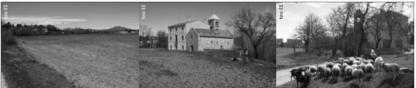
Imatges actuals dels camps de Sant Pau de Riu-Sec.

Per a garantir aquests objectius estratègics defensem una intervenció pública tan en el projecte com en la gestió d'aquest Pla.