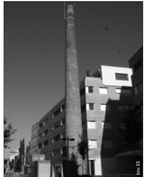
Plaça Joan Olius.