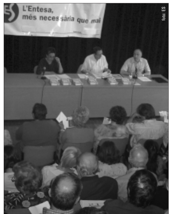
Assemblea de l'Entesa. 31 de maig de 2005.

Finalment, l'Assemblea va valorar positivament l'intens treball portat a terme pel Secretariat, pel Grup Municipal i per tota l'organització.