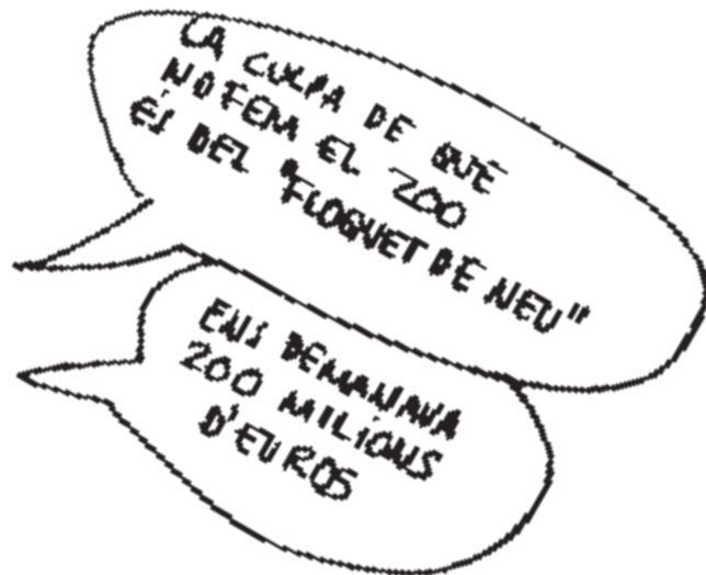
Zoo: Excuses Bustos, S. A.